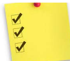
Podrobnejša zakonska razdelava obveznosti