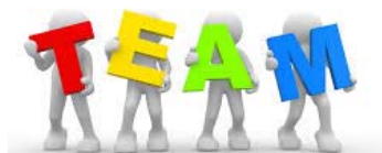
Zagotavljanje kompetentnih strokovnjakov